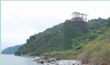
②石灰石貯蔵タンク ※高さ約15m 本村上鉦山の岸壁に設置された石灰石貯蔵タンク(2,300t収納)。昭和9年に日東セメント(株)が設置するも、同16年に同鉦山は浅野セメント(株)の傘下となる。昭和52年に閉山。