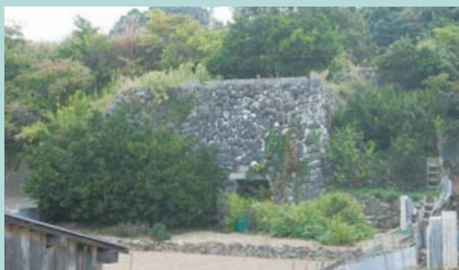
④石灰窯 ※幅約10m、高さ約5m 肥料用石灰を焼成するための窯で、焚き口は2つあり、内部は徳利状の耐火煉瓦構造をしている。大正～昭和初期の築造か。こうした窯跡が、島内にはまだ数基残っている。