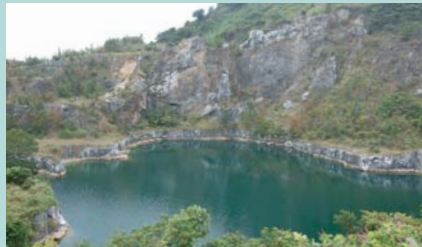
①カネ源水源地 ※海底送水管で岡村島へ送る 石灰岩の採石場跡にできた水源地で、名称は鉦山経営者の屋号。同鉦山は小大下鉦山と呼ばれ、昭和7年に大阪窯業セメント(株)が機械設備を導入後に採掘量が増えるも、同48年に閉山。