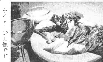
※イメージ画像です

【お問い合わせ先】 グルメ・海の印象派 - おのみち - 実行委員会 （尾道商工会議所内） TEL 0848-25-3863