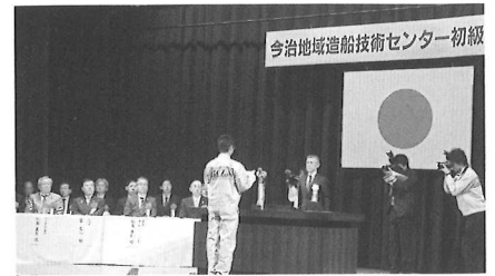
研修生代表決意表明

4月12日(金)、午前10時から波方公民館において、造船、船用工業の若手技術者を育成する、今治地域造船技術センターの第15回初級研修が開講した。