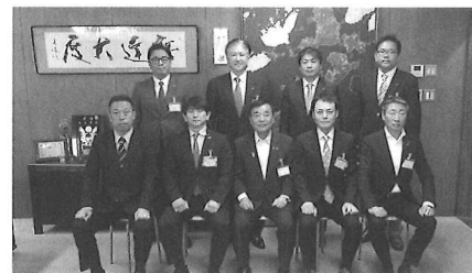
菅今治市長を囲んで記念撮影

5月7日(火)、当会正副会長等が今治市長を訪問し、今年度における事業の説明や市制について意見交換を行った。今年度も引き続き「市長と華ランチ」を行い、活発な意見交換を行っていく。