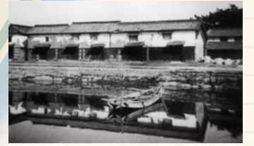
椀船が寄港した内港と漆器倉庫 (昭和13年)

江戸時代後期頃から、桜井商人は紀州黒江の漆器を大量に仕入れ、西国方面へ廻船行商を行うことで躍進。やがて桜井でも漆器製造を始めるものが現れ(天保年間頃)、明治後期～大正期頃に最盛期を迎えます。その頃に、桜井商人が中心となって、漆器・呉服・家具などを取り扱う月賦販売を始め全国に広めています。