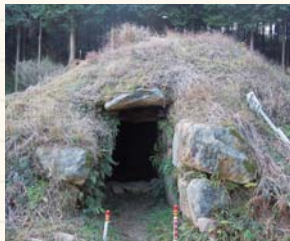
② 五間塚古墳 (市指定史跡) 王塚とも呼ばれる円墳で、横穴式石室の全長は9m。