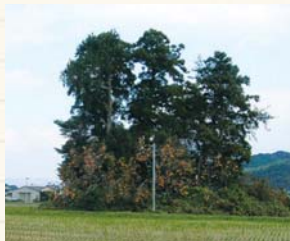
樹之本古墳 (市指定史跡) 周越道路沿いにある古墳時代中期(5世紀頃)の円墳で、希少価値の高い青銅鏡(細線式獣帯鏡)や埴輪・陶質土器などが出土している。※青銅鏡は東京国立博物館所蔵

野々瀬地区以外にも、朝倉地域には古谷地区の多伎神社境内などに円墳の群集墳が現存しています。朝倉地域から出土した考古資料は、朝倉ふるさと美術古墳館で見学できます。 ※朝倉ふるさと美術古墳館(月曜休) 0898-56-3754