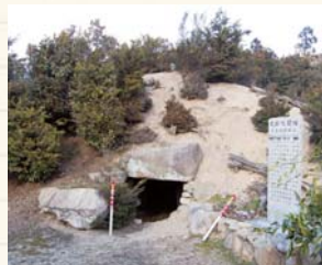
① 七間塚古墳 (県指定史跡) 直径20m前後の円墳で、横穴式石室の全長は10m。