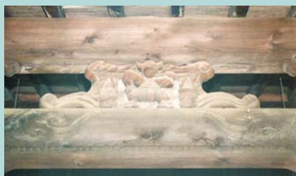
③ 山神社 ※水桶を両肩に担ぐ、高下駄を履いた石灰職人石灰鉦山の繁栄を願い、大山積神を祀る。拜殿の梁には、石灰製造を行う職人の姿がかたどられている。石鳥居は、大正5年に大阪窯業(株)の現地支配人が寄進したもの。