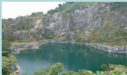
① カネ源水源地 ※海底送水管で岡村島へ送る 石灰岩の採石場跡にできた水源地で、名称は鉦山経営者の屋号。同鉦山は小大下鉦山と呼ばれ、昭和7年に大阪窯業セメント(株)が機械設備を導入後に採掘量が増えるも、同48年に閉山。