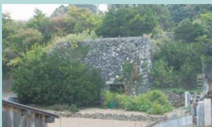
④ 石灰窯 ※幅約10m、高さ約5m 肥料用石灰を焼成するための窯で、焚き口は2つあり、内部は徳利状の耐火煉瓦構造をしている。大正～昭和初期の築造か。こうした窯跡が、島内にはまだ数基残っている。