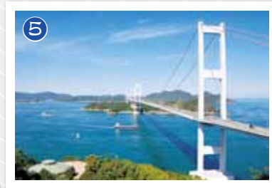
来島海峡 (系山展望台からの眺め)

系山公園が整備されるのは昭和30年代以降のことです。句碑・歌碑の建立が物語るように、来島海峡に臨む景勝地としてその名を知られるようになっていきました。平成11(1999)年春にしまなみ海道が開通すると、これに合わせて新たな施設が誕生し、サイクリストの四国を関口として、さらなる賑わいを見せています。