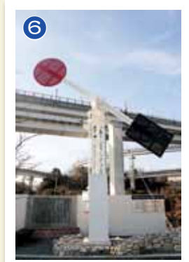
潮流腕木式信号機