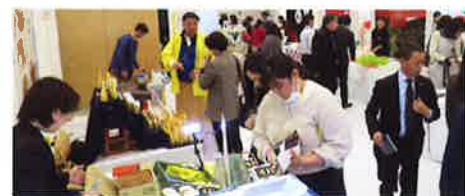
○しまなみ・やまなみ4会議所連携事業

新たな地域資源の発掘や、観光振興、まちづくりに関する事業など、地域の活性化に資する活動を展開しています。