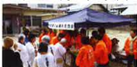
○四国八十八ヶ所巡礼お接待

会員事業所で、商工業に従事する女性が知識と教養を深め、女性ならではの視点でイベント、交流事業に積極的に参加し、商工業の振興と社会福祉増進に寄与する活動を行っています。